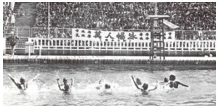
1972年8月4日在九龍仔泳池，由市政局、民政署、香港拯溺總會及南華早報聯合舉辦第七次「萬人暢泳」，圖為救生示範表演