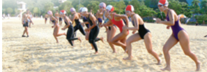
拯溺海洋分齡賽每年舉行三個回合，三個回合累積得分最高者可獲該項目的全年冠軍，圖中為女子海浪游泳賽的起步。

日期：原定2009年6月21日(星期日)因惡劣天氣關係而順延至2009年6月28日(星期日)舉行 時間：上午8:00至下午3:00 地點：淺水灣泳灘 主辦：香港拯溺總會 參賽人數：56人