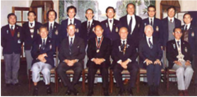
1987年1月12日考試委員會三十週年會慶一級主考合照

前排左起：郭漢銘(總主考)、潘雅文(三軍司令)、霍英東(考委會主席)、 馮秉芬(救生會會長)、顏理國(警務處長)、盧錦倫(秘書長)