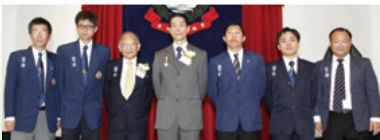
長期服務獎章人士與頒獎嘉賓盧振雄處長合照