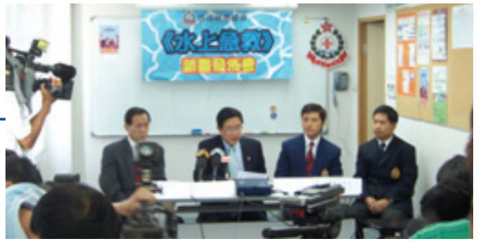
《水上急救》新書發佈會

在回顧香港水上急救的發展當中，陳醫生表示，在未正式有水上急救技術以前，部份先進國家有不同的水上脊柱骨折處理技術，及後慢慢改良及演變出水上急救技術。在1998年，國際救生聯盟