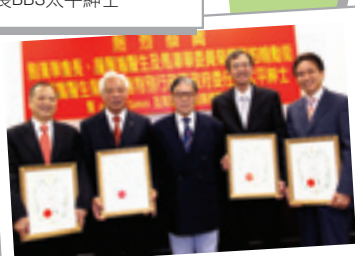
各獲授勳人士與總裁霍震霆GBS太平紳士合照