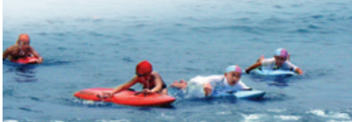
拯溺(海洋及沙灘)分齡賽每年舉行一次，年齡分組與普通的泳池賽相同，由8歲開始分為6個組別，圖中為男子少年甲的海浪板速度賽。

日期：2009年5月31日(星期日) 時間：上午8:00至下午3:00 地點：石澳泳灘 主辦：香港拯溺總會 資助：康樂及文化事務署 參賽人數：207人 參與屬會：17個