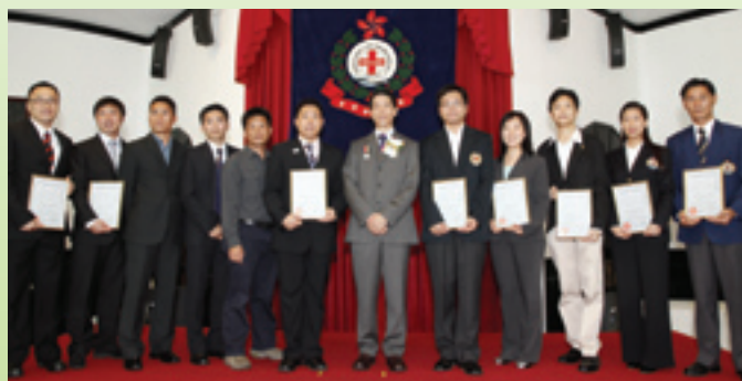
長期服務獎狀人士與頒獎嘉賓盧振雄處長合照